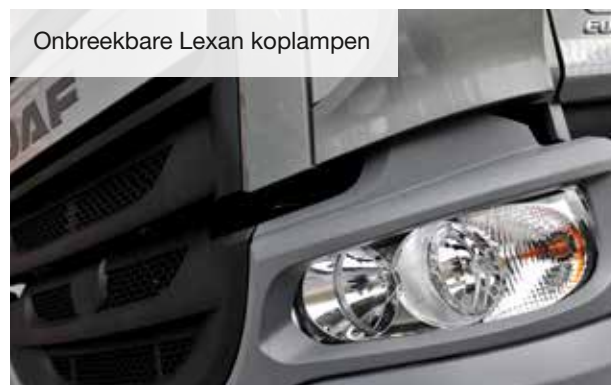
Onbreekbare Lexan koplampen