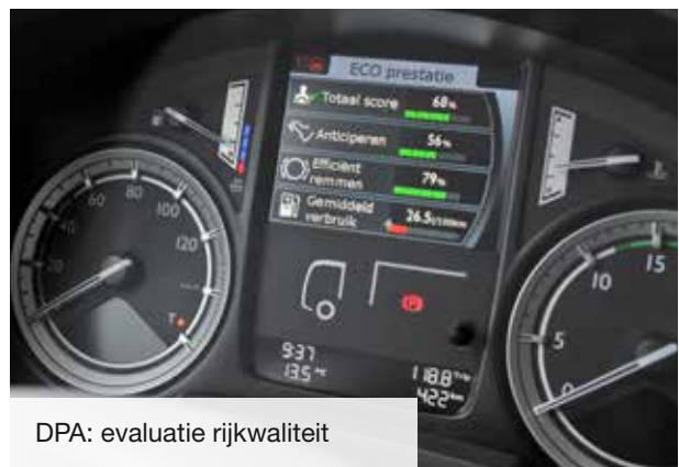
DPA: evaluatie rijkwaliteit