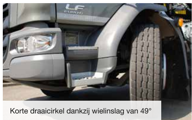
Korte draaicirkel dankzij wielinslag van 49°