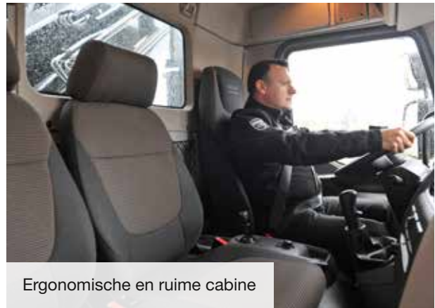
Ergonomische en ruime cabine

Nieuwe comfortabele stoelen, een nieuw stuurwiel en een dashboard met alle schakelaars overzichtelijk per functie gegroepeerd. De cabine van de LF Construction is de ideale werkplek. DAF's Driver Performance Assistent (DPA) ondersteunt de chauffeur bij het meest efficiënte gebruik van het voertuig. Het interieur laat zich gemakkelijk schoonmaken. Extra belangrijk bij een truck die regelmatig 'off road' gaat.