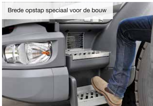
Brede opstap speciaal voor de bouw