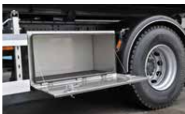
Ruime roestvrije werkcoffer 500H x 500D x 800B (mm)