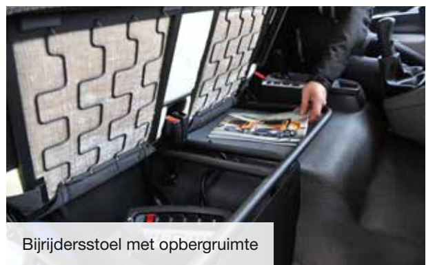
Bijrijdersstoel met opbergruimte